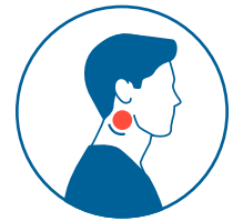
Ganglios linfáticos inflamados

El departamento de salud le dará instrucciones sobre cómo vigilar su salud y hablará con usted a diario. Puede continuar con sus actividades normales durante este tiempo si no tiene ningún síntoma.