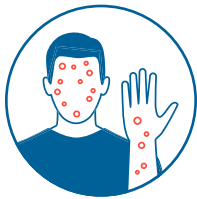
Erupción cutánea en cualquier parte del cuerpo (aunque sólo sean 1 o 2 manchas)

Después de la exposición, vigile su salud durante 21 días. Esté atento a cualquiera de estos síntomas: