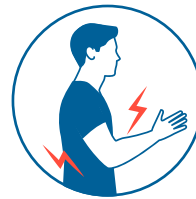
Dolores musculares y de espalda