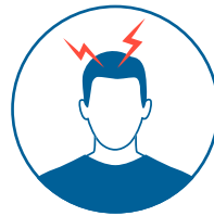
Dolor de cabeza