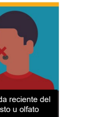
Pérdida reciente del gusto u olfato