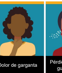
Dolor de garganta