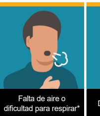
Falta de aire o dificultad para respirar*