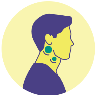
Ganglios linfáticos inflamados