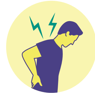
Dolores musculares y/ o Dolores de espalda