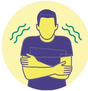
ብርድ ብርድ ማለት