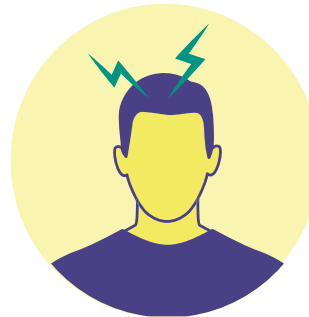
Pananakit ng ulo