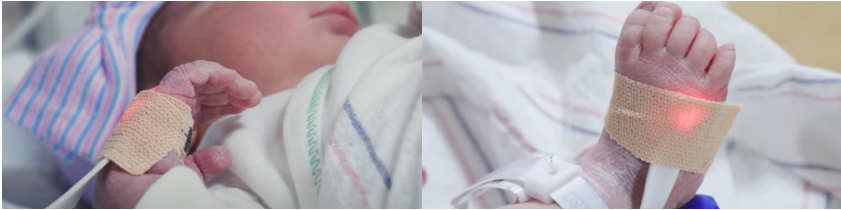
የCCCHD ምርመራ ለማድረግ በቀኝ እጅና በእግር ላይ የሚደረጉ የልብ ምት ኦክሲሜትሮች